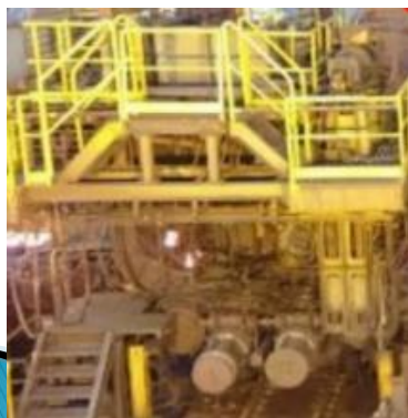
廠區製程及用水清查