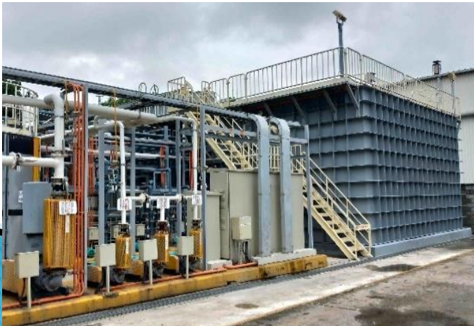
製程廢水回收: MBR、RO系統