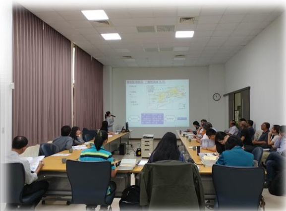
現地督導考核辦理情形