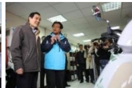
102年1月5日馬總統參觀艾上綠能電動機車租賃服務。