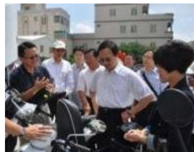
101年9月24日江院長參觀澎湖7-11快速充電服務。